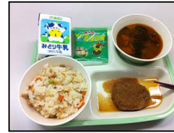
小学校の給食メニュー