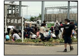
半田工場芋掘りの風景