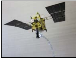
小惑星探査機 はやぶさ