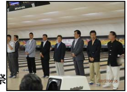
ボーリング大会開会式