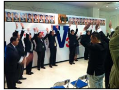
碧南市議選トップ当選