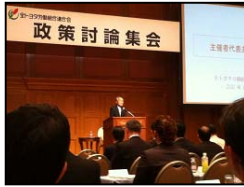
全トヨタ政策討論会(名観ホテル)