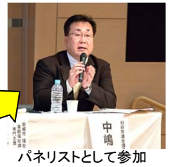
パネリストとして参加