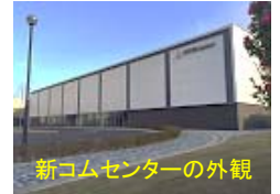
新コムセンターの外観

さて、昨年はアイシン精機創立50周年という節目を迎え、新たな50年への歩みを始めました。9月には新コムセンターがオープンし、刈谷市長も来賓としてテープカットして頂きました。特にプロジェクションマッピングで自社製品と技術を紹介するブースでは、「すごいですね」と市長の一言。どなたも見学可能ですので、是非ご来場頂きたいと思っております。