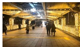
刈谷駅イルミネーション

新型コロナウイルスが世界的なパンデミックとなって約2年が経過しました。ワクチン接種により、第5波も収束と思われていました。しかし、新たな「オミクロン株」により再び不透明な状況となり、3回目接種が加速されています。刈谷市も医療従事者から順次開始しています。そんな中ですが、地元経済も徐々に再開しました。飲食店のキャッシュレス還元や5千円のクーポン券配布などで、市もバックアップしています。安全・安心を前提に、元氣と活気が戻ってくれることを期待します。